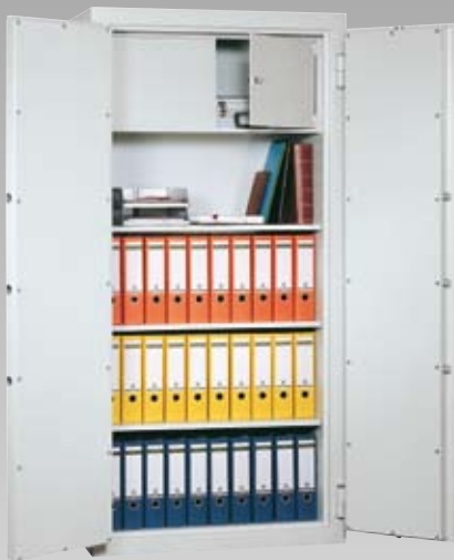
Abb.: DK 195/3 (mit Sonderausstattung Innentresor)